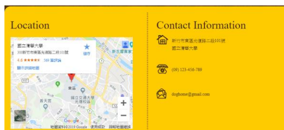
Figure 5 Google Map與聯絡資訊