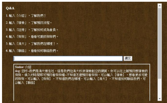
Figure 6 聊天機器人

而對於清大懷生社從管理者的角度出發，在登入之後可以在網頁上看到目前的預約資訊，以供聯絡相關事宜，根據預約的時段安排人力後，確定或拒絕預約(Figure 7)。