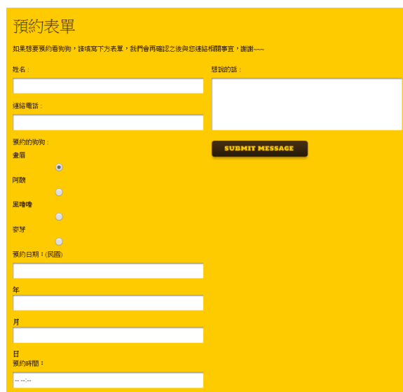
Figure 4 線上預約功能