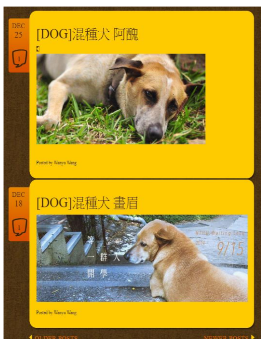
Figure 2 觀看狗狗介紹