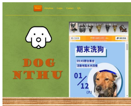
Figure 3 網頁嵌入FB

我以清華大學關懷生命社的角度出發，建立一個校園流浪犬的領養平台，一方面希望增加清大校浪的曝光度，讓大家知道清大校浪也是一個可以領養的選擇，不一定要到收容所才能領養，另外，由於清大懷生社社員皆為自發性幫忙照顧校浪，因此未必隨時隨地都有人待命協助領養，再加上不同於一般收容所，清大校浪的活動範圍廣泛且不定，必須事先預約才能預先找到狗狗進行親密接觸，故建立NTHU DOG平台，領養人可以在上頭觀看狗狗介紹(Figure 2)、也可透過平台連線至FB(Figure 3)，再認識、了解狗狗基本資訊之後若喜歡，可以線上預約時段接觸狗狗(Figure 4)，倘若不知道清大位置，網站上也有附上Google Map可供參考(Figure 5)。如果對於網站或領養程序有問題，也可到QA地方詢問聊天機器人(Figure 6)。